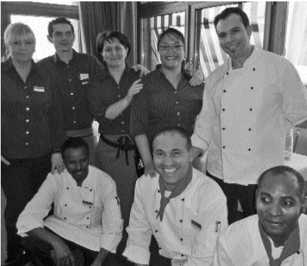
Superservice im UBS Sportzentrum Guggach.

Beim präsidentialen Ausblick kam kurz etwas Wehmut auf, denn es war bereits wieder der letzte Jahresschlusscocktail in dieser für uns so hervorragend geeigneten Lokalität. Die UBS hat das Sportzentrum auf Mitte des nächsten Jahres «versenkt» und das Gelände für den lukrativeren Wohnungsbau verkauft ... Damit sieht sich der TVU 60plus zum dritten Mal innert dreier Jahre genötigt, eine neue «Heimat» zu suchen. Und wer einmal so optimal bedient war, wird natürlich für die Zukunft wählerisch.