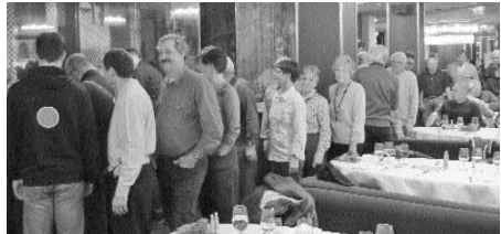
Lange Schlange am vorzüglichen Büffet.

allgemeinen Zuspruch, denn draussen wechselten sich Regen und Sonnenschein in unregelmässigen Abständen ab. Da war das Büffet im Metropol eine verlockende Alternative, auch wenn die Organisation der Selbst-