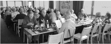
Zweimal volles Haus im Dezember.

pt) Die beiden Dezember-Anlässe, die sich jeweils innert drei Tagen folgen, zogen erneut eine Rekordzahl an Gästen an. Am Jahreschlussshock waren 70 Mitglieder dabei und am Silvesterlauf-Lunch (mit Begleitung und Gästen) waren es sogar 82 Teilnehmer/innen, die sich zum Mittagessen trafen. Geht man dabei die Teilnehmerlisten durch, so stellt man fest, dass fast vierzig Personen beide Male anwesend waren, so dass für sie innerhalb einer halben Woche zwei praktisch identische Veranstaltungen stattfanden. Und das kann eigentlich nicht der Sinn der Sache sein, denn eine solche Ballung bringt die Gefahr des Überdresses mit sich. Das ist auch den verantwortlichen Organisatoren aufgefallen, und man sucht für das kommende Jahr nach einer neuen Lösung. Dann wird nämlich der Silvesterlauf auf einer neuen Strecke gelaufen, da der Münsterhof langfristig saniert und um-