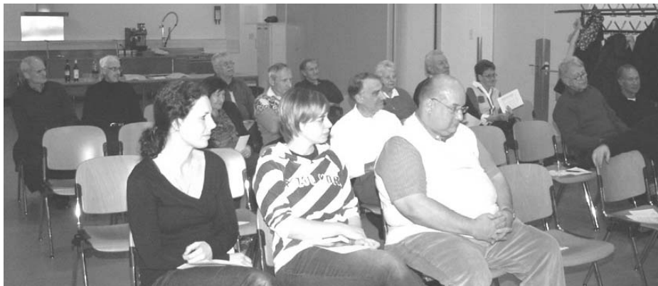
Aufmerksame Delegierte beim Jahresbericht des Zentralpräsidenten.

Verein, ohne Auseinandersetzungen. Die Finanzen sind im Lot, auch wenn die Geldanlagen zurzeit kaum etwas abwerfen. Der Silvesterlauf ist nach wie vor auf Expansionskurs mit einer neuen Rekordbeteiligung 2011 und der LAC glänzte mit guten Resultaten, u.a. im Nachwuchsbereich. Freude bereitet ihm aber auch das Gedeihen der «Übersechziger», welche im TVU 60plus einen Rahmen geboten erhalten, welcher fast alle Wünsche erfüllt. Das schlägt sich dann auch mit fast 20 Neueintritten in einem Jahr nieder. Das Teamwork beim Vereinsorgan wurde öffentlich gelobt, und die Administration wird unter Leitung von Gaby und Martin Fäh, Thomas Zudrell und Stefan Kälin ständig auf dem neuesten Stand gehalten, und der Internetauftritt des TVU darf sich ebenfalls sehen lassen. Nicht zu vergessen die Leistungen, welche Corinne Meier (LAC) im Sekretariat auch für den Gesamtverein erbringt. Fazit für den Zentralpräsidenten: Das Erfreuliche überwiegt bei weitem und dort, wo noch Verbesserungs-