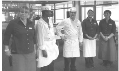
Viel Applaus für das Service-Team.