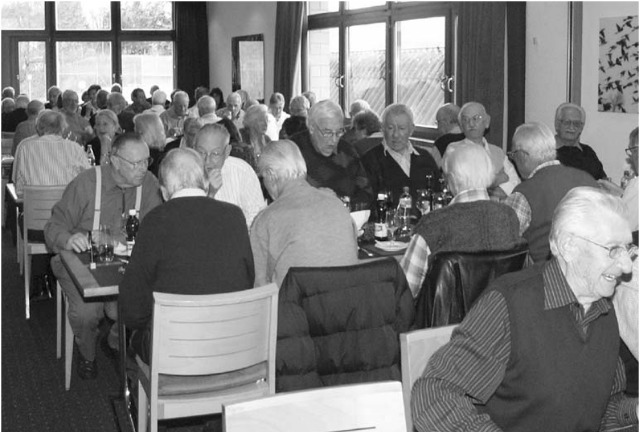
UBS Guggach: Volles Haus beim Jahresschlusscock.

Bevor man sich auf den Heimweg machte, gab es zwei mögliche Varianten der Verabschiedung: Man wünschte sich schöne Feiertage und einen guten Rutsch ins neue Jahr, oder man sagte sich gegenseitig: «Also dann bis am Sonntag! Wir sehen uns ja am Silvesterlauf-Lunch wieder ...»